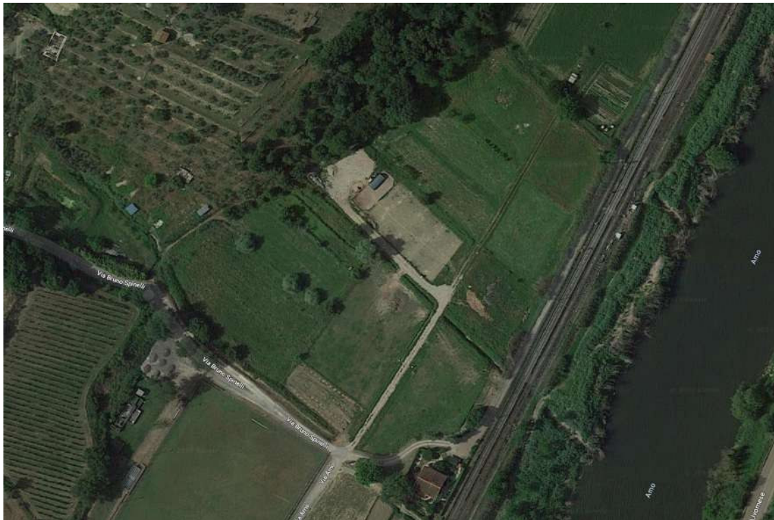
Figura 2: Ortofoto estesa al contesto

Con riferimento agli elementi indicati all'art. 3.1, lettera "A", punto "1", del D.P.C.M. 12/12/2005, la descrizione dei caratteri paesaggistici prende in considerazione: