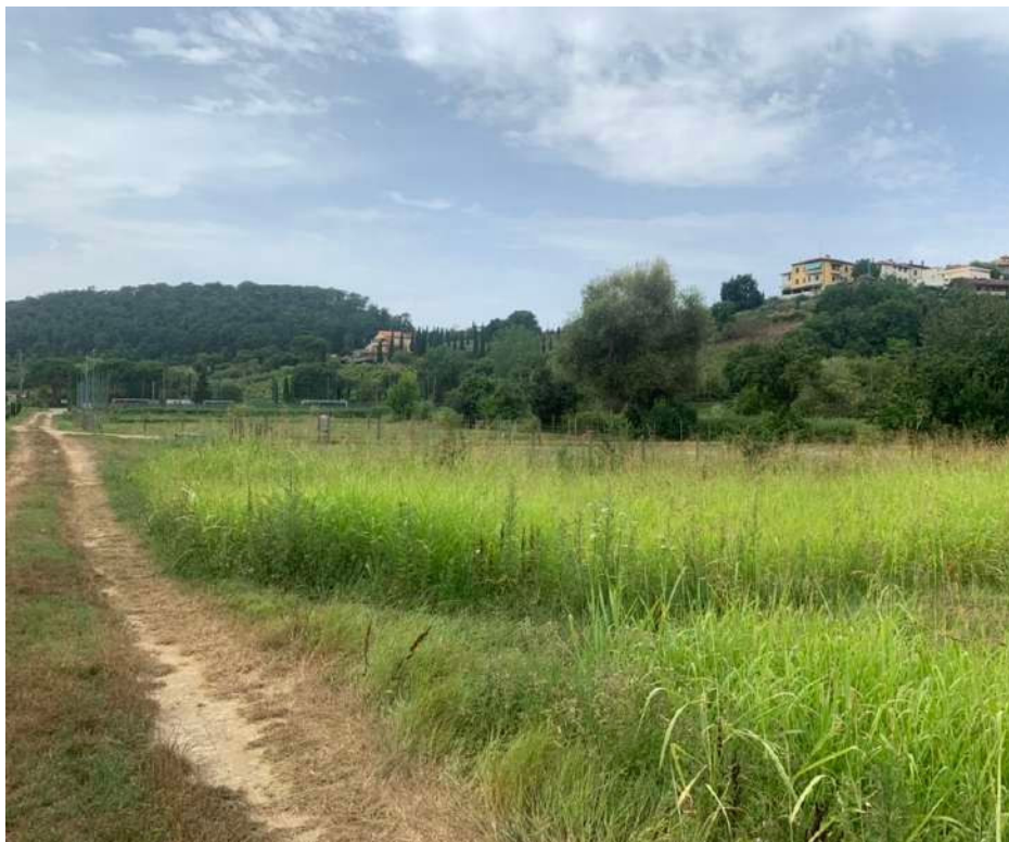
Figura 5: Foto dell'area di intervento prima dell'inizio dei lavori

Più rilevante l'incidenza della "Disciplina dei beni paesaggistici" contenuta nel P.I.T. approvato con Deliberazione Consiglio Regionale 27 marzo 2015, n.37 che assume valore di Piano paesaggistico ai sensi degli artt. 134 e 143