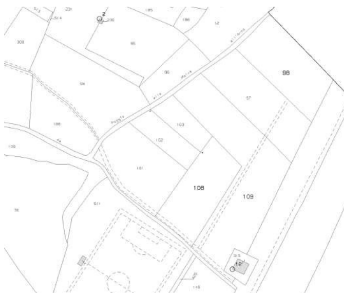
Figura 1: Estratto Mappa catastale fg. 52 p.lle 108,109 e 98